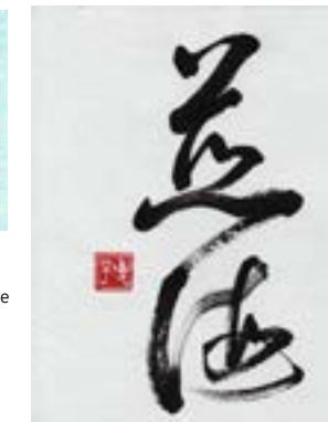
Twee uitvoeringen van Jikai. Een stempel en een kaligrafie van Hiroko Ishikawa